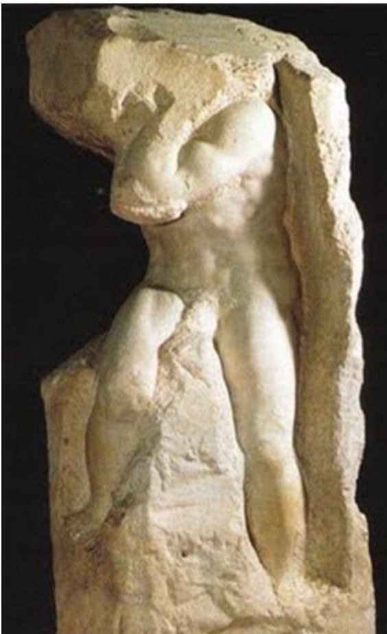
Michael Angelo Die onvoltooide beeld

... WIL TUINEDAL 'N VEILIGE RUIMTE WEES WAAR GOED VERSORGDE EN TOEGERUSTE LIDMATE GESTUUR WORD NA 'N STUKKENDE WÊRELD – TOT EER VAN GOD.